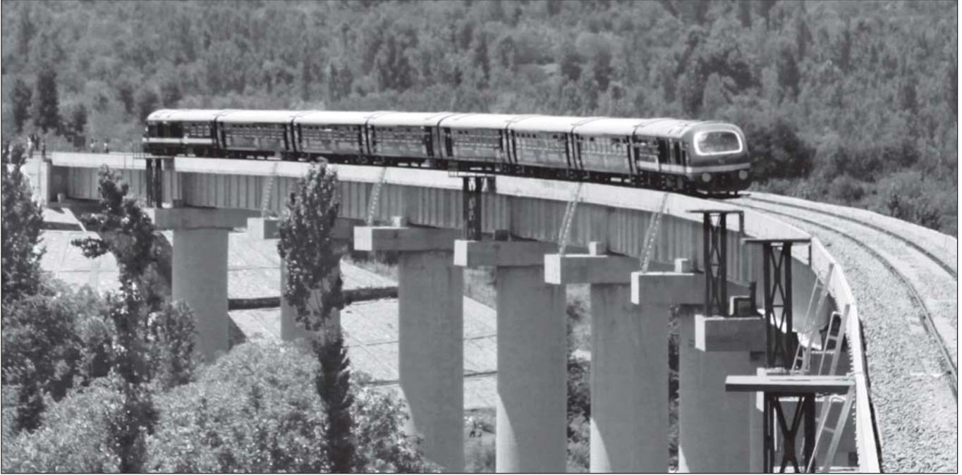
जम्मू कश्मीर परियोजना में डीजल मल्टिपल इकाई