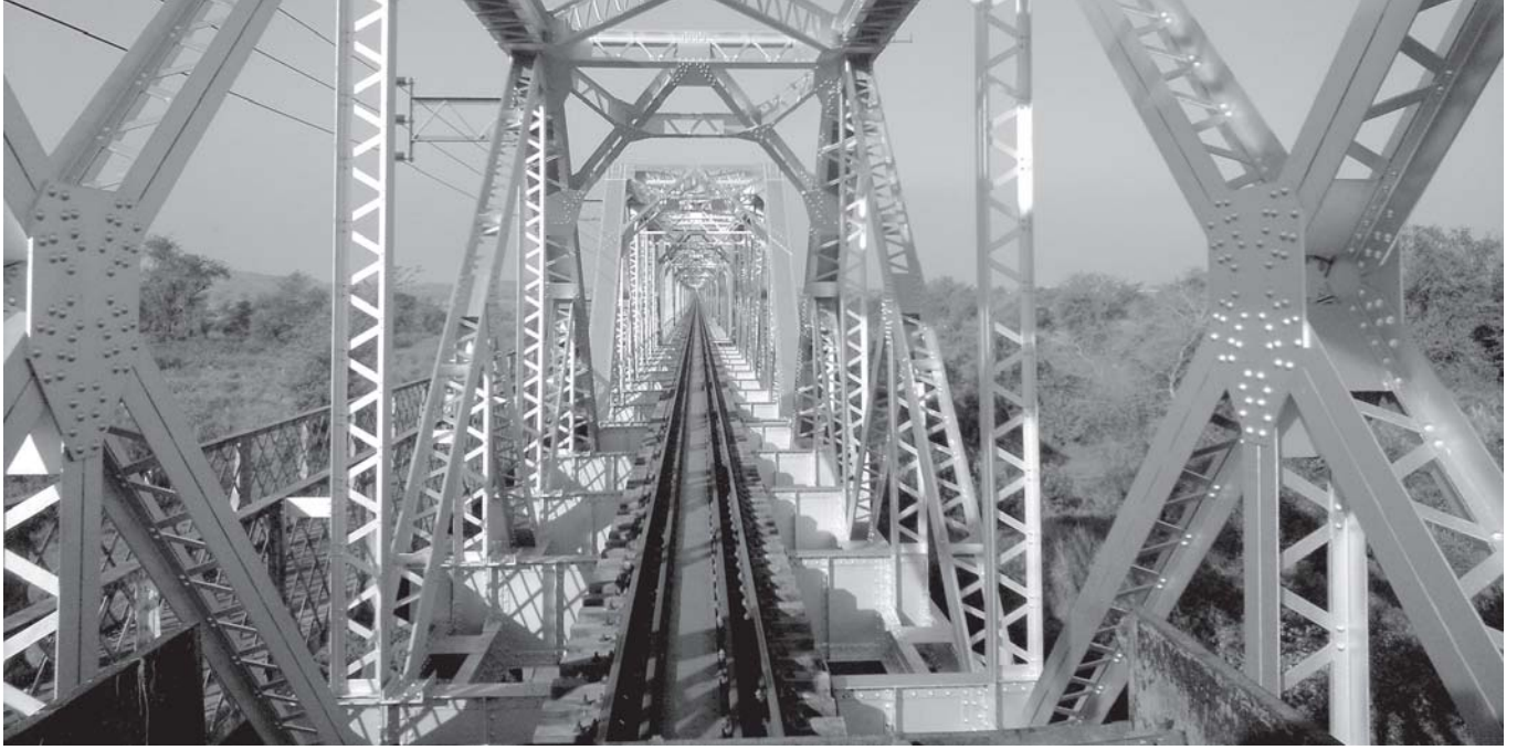
मोजांबिक में डोना एना पुल का पुनर्निर्माण

इस संयुक्त उद्यम कंपनी में इरकॉन की वित्तीय प्रतिबद्धता इस प्रकार है: