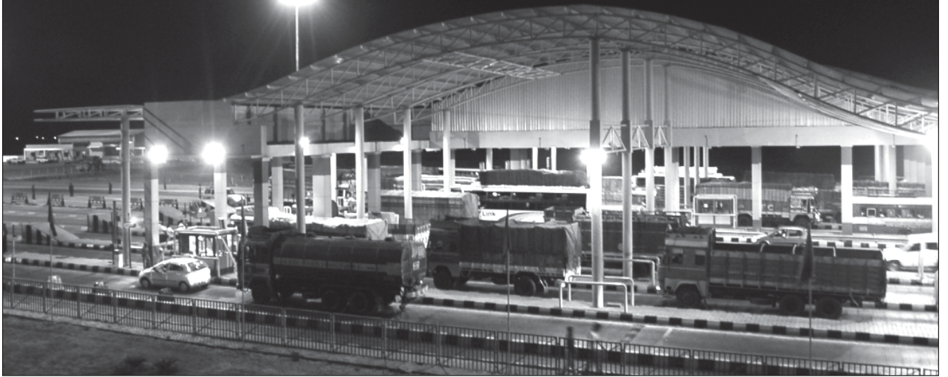
टोल प्लाजा - धूले पिम्पलगांव परियोजना

आपकी कंपनी ने अपनी वर्तमान शेयरधारिता का वचन दिया है। आईएसटीपीएल द्वारा प्रमुख ऋणदाता बैंक, भारतीय स्टेट बैंक सहित 8 बैंकों से लिए गए 4500 मिलियन रुपए के ऋण अवधि के संबंध में इरकॉन ने आईएसटीपीएल में अपनी शेयरधारिता का वचन प्रस्तुत किया है।