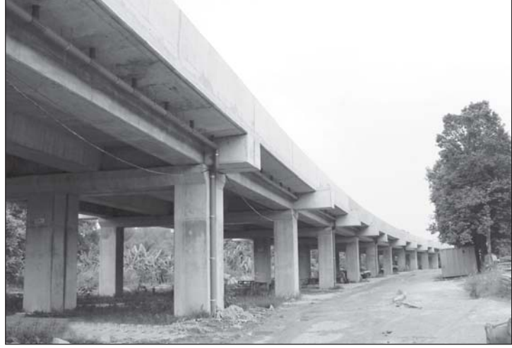
सेतुपुल मलेशिया परियोजना