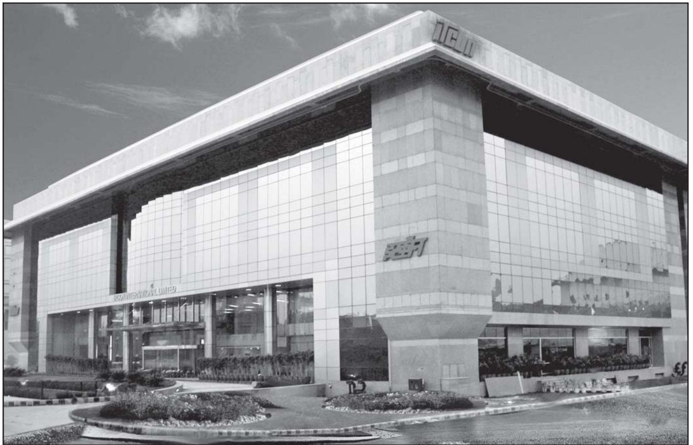
साकेत, नई दिल्ली में इरकॉन का निगमित कार्यालय भवन

दिल्ली स्टॉक एक्सचेंज एसोसिएशन लिमिटेड, डी एस ई हाऊस, 3/1 आसफ अली रोड, नई दिल्ली-110002