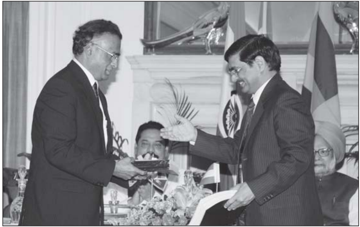
भारत के प्रधानमंत्री तथा श्रीलंका के राष्ट्रपति की उपस्थिति में इरॉन के प्रबंध निदेशक द्वारा करार पर हस्ताक्षर

वर्ष की समाप्ति के पश्चात, आपकी कंपनी ने जून, 2010 में 149.74 मिलियन अमरीकी डालर के कुल मूल्य पर मधु रोड से तलई मन्नार तक रेल लाइन के पुनर्स्थापन के लिए श्रीलंका सरकार के साथ एक संविदा करार किया है। भारतीय एग्जिम बैंक तथा श्रीलंका सरकार के बीच ऋण करार पर हस्ताक्षर किए जाने के पश्चात ही यह संविदा प्रचालन में आएगी।