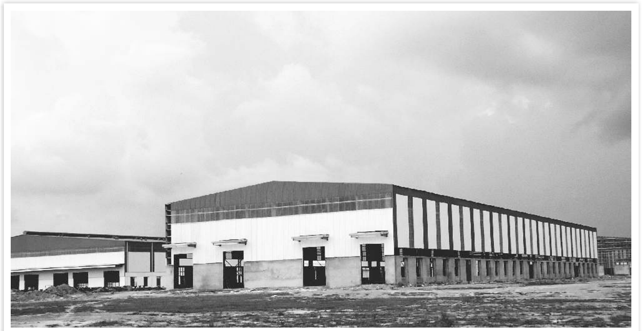
रायबरेली में रेल डिब्बा कारखाना

वर्ष की समाप्ति के तत्काल पश्चात , कंपनी को ₹ 624 करोड़ मूल्य पर राजस्थान में 26 सड़क उपरिपुलों के निर्माण की एक परियोजना अप्रैल 2011 को प्राप्त हुई है।