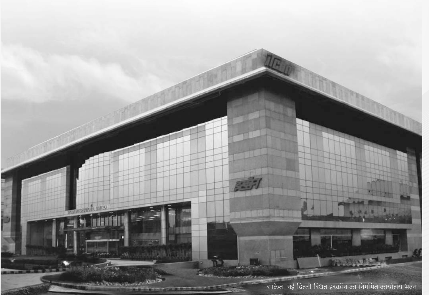
साकेत, नई दिल्ली स्थित इरकॉन का निगमित कार्यालय भवन

दिल्ली स्टॉक एक्सचेंज एसोसिएशन लिमिटेड, डी एस ई हाऊस, 3/1 आसफ अली रोड, नई दिल्ली-110002