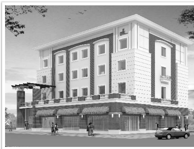
सिलीगुडी में बहुउद्देशीय परिसर का चित्र निर्मित

वर्ष के दौरान, आपकी कंपनी ने प्रौद्योगिकीय विकासों की आवश्यकताओं को पूरा करने के लिए एक मध्यकालीन अनुसंधान एवं विकास योजना तैयार की है। आपकी कंपनी कोई विशुद्ध अनुसंधान परियोजना पर कार्य नहीं करती है किन्तु अपेक्षित गुणवत्ता के साथ लागत कुशलता के रूप में विभिन्न