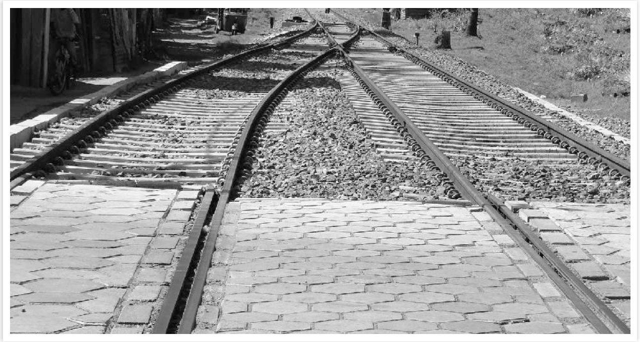
कोलम्बो-मतारा तटीय रेल लाइन