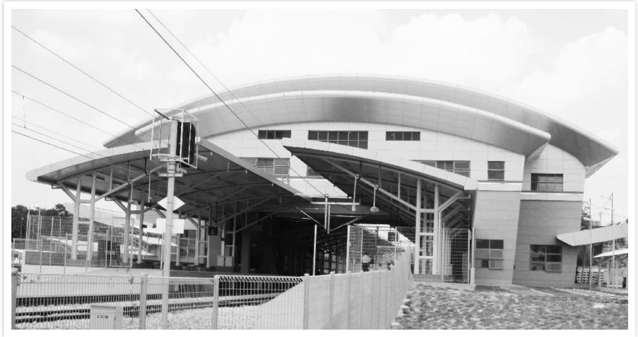
मलेशिया में सेरेम्बन रेलवे स्टेशन भवन