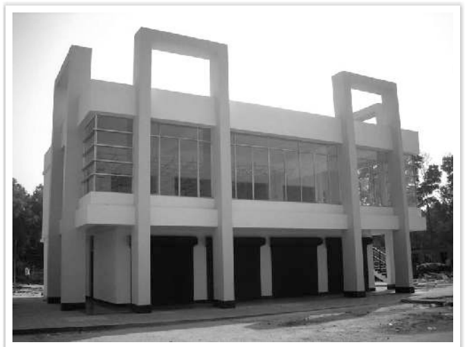
दीघा में बहुउद्देशीय परिसर का चित्र निर्मित