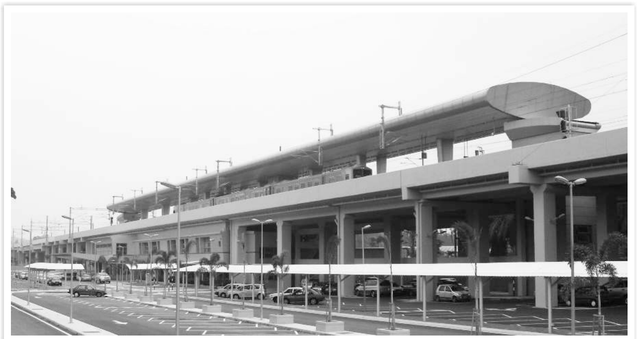
मलेशिया में वायडक्ट पर स्टेशन भवन