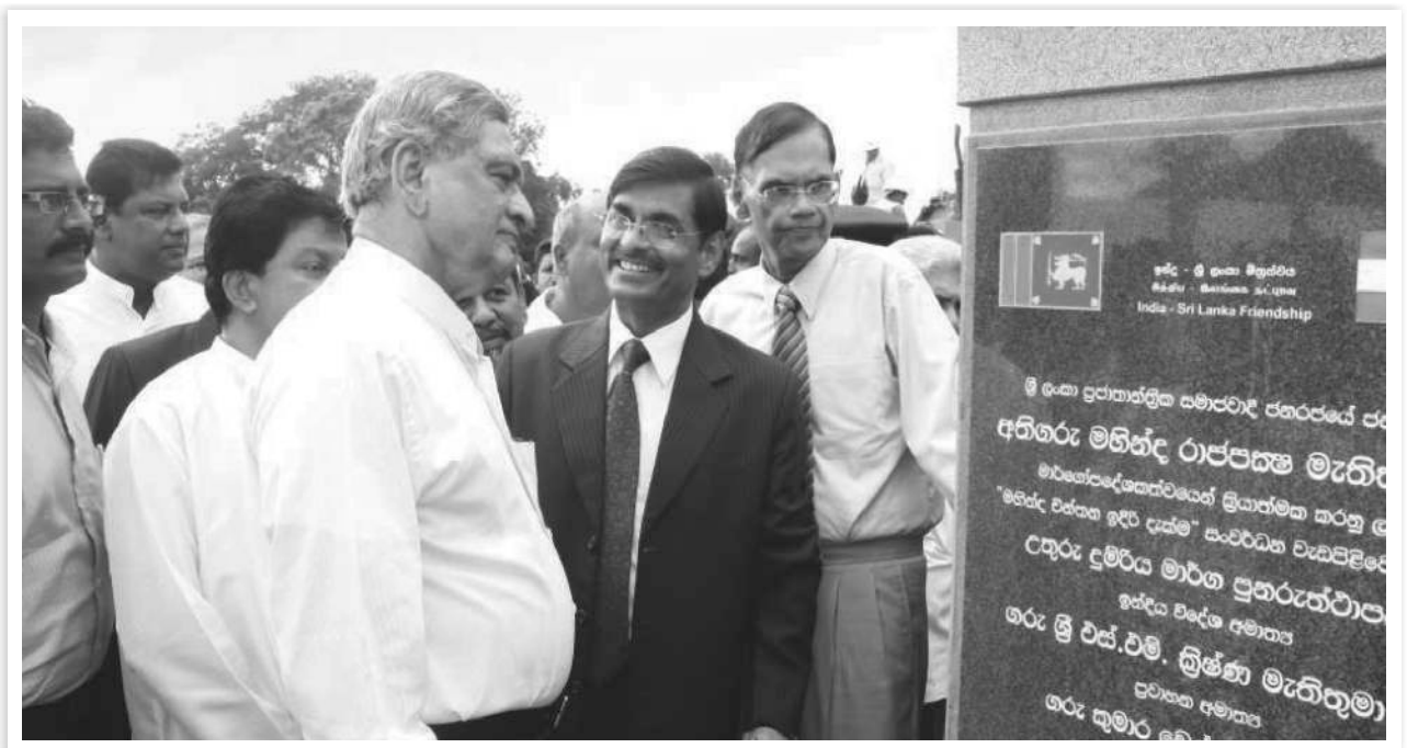
श्रीलंका में उत्तरी परियोजनाओं का उद्घाटन समारोह